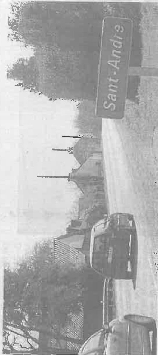
Sur le projet d'aménagement de la RN 164, la déviation de Saint-André par le Nord recueille la quasi-unanimité des riverains. Mais ces derniers rejettent massivement le principe d'un demi-échangeur.

Concernant les deux variantes de l'échangeur RN 164 et RD 36, il est souhaitable de retenir le projet comportant le moins de nuisances sonores de la bretelle d'entrée en venant de Carhaix. La déviation de