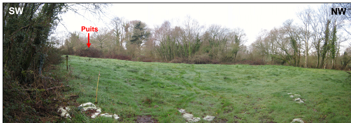
Vue d'ensemble de l'ancien carreau minier