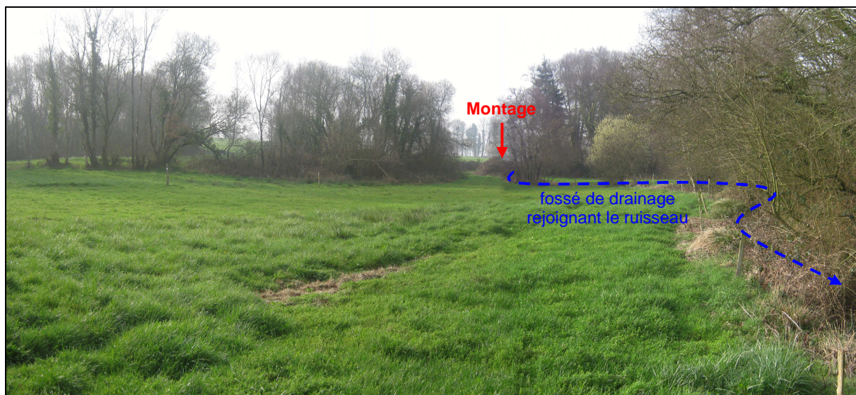
Localisation du fossé de drainage des eaux de surface mis en place par le locataire actuel