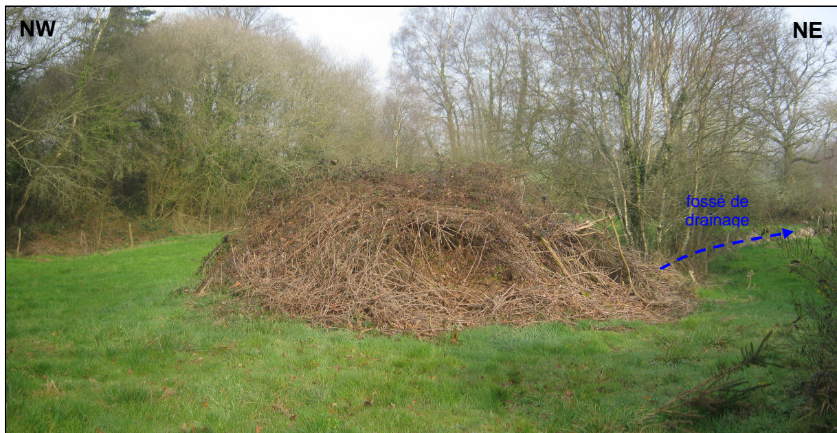
Tumulus matérialisant le montage