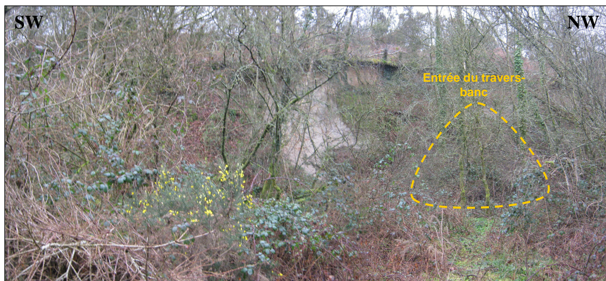
Entrée du travers-banc, située en fond de vallée