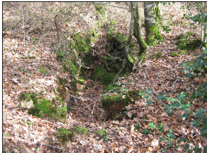
Tranchée T2 de 1 m de profondeur et 1,5 m de longueur