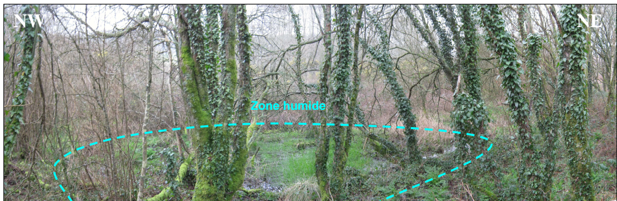
Zone humide située à proximité immédiate de l'ancien carreau minier