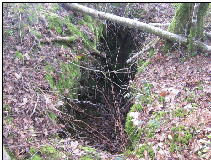
Tranchée T3 de 1 m de profondeur et 2 m de longueur