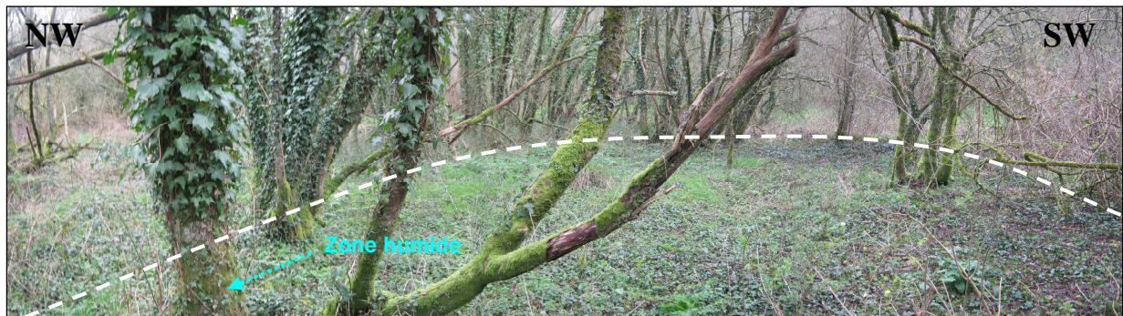
Ancien carreau minier