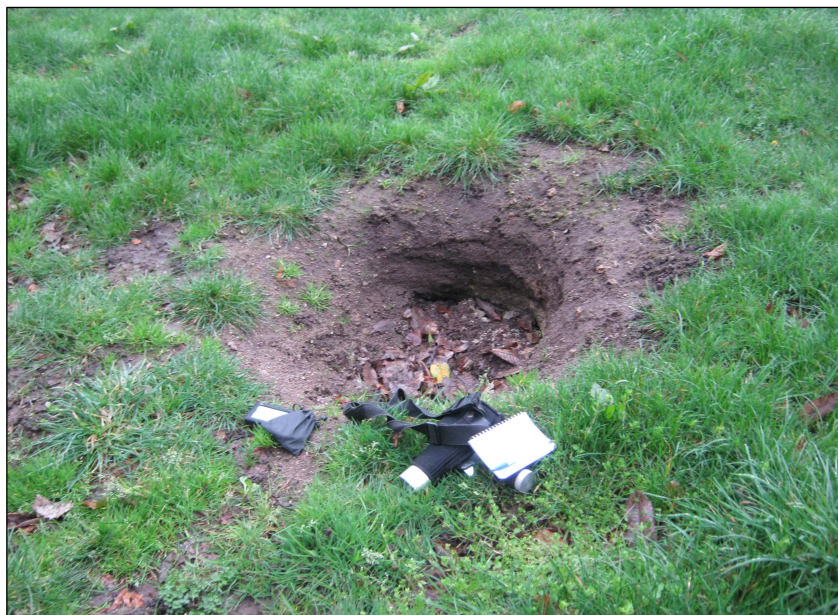
Fontis constaté au droit des dépilages (remblayé en 2011)