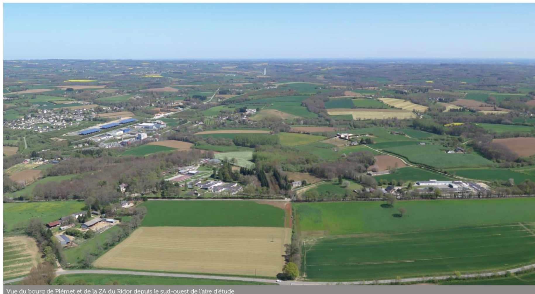
Vue du bourg de Plémet et de la ZA du Ridor depuis le sud-ouest de l'aire d'étude