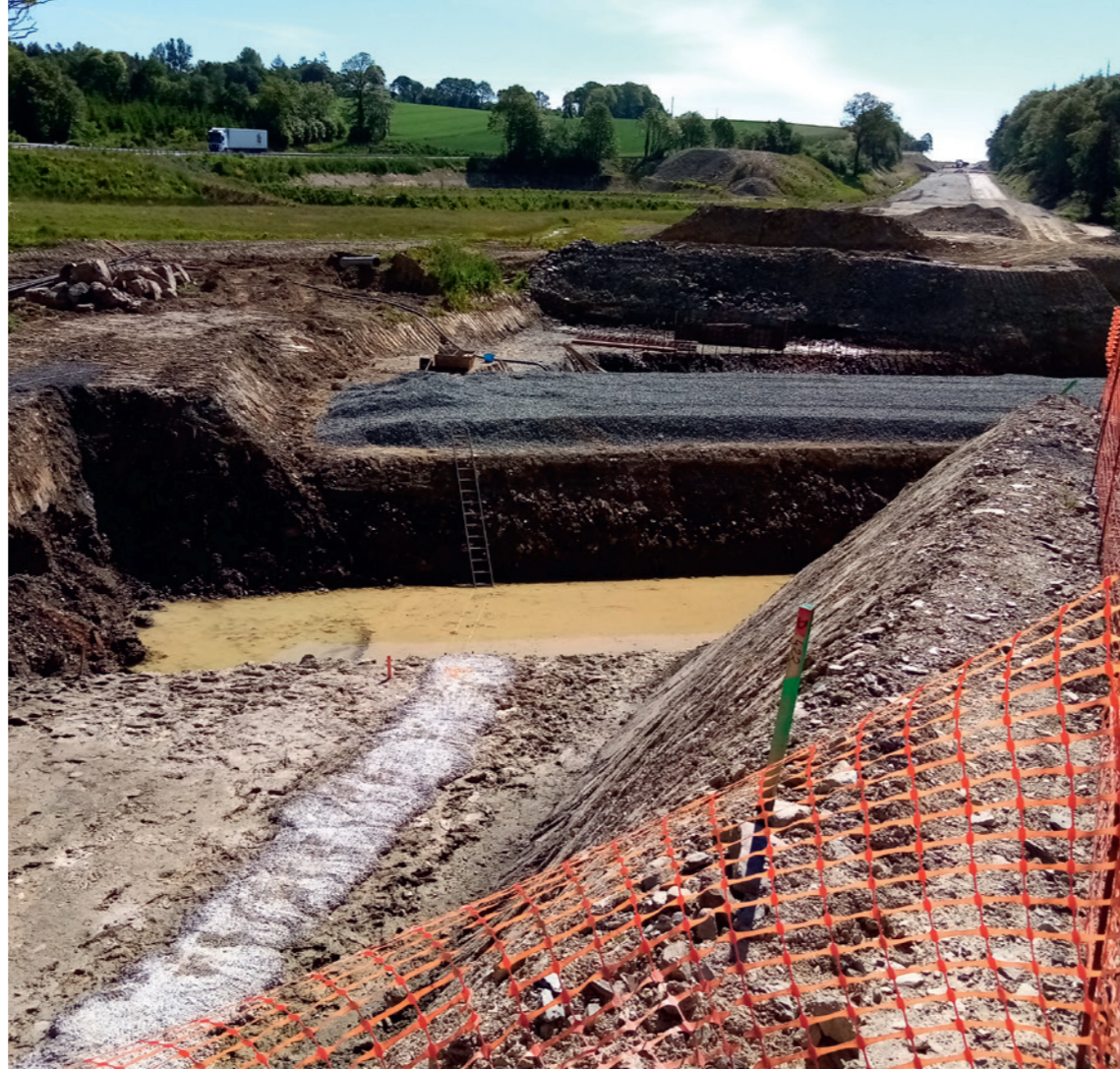
Terrassement aux abords du Ster Goanez - construction de l'ouvrage d'art (AO1).

Les échéances de mise en service envisagées sont à ce stade: décembre 2020 pour la section centrale, printemps 2021 pour la section Est, fin d'été 2021 pour la section ouest. Fin 2021, toute la RN164 sera à 2x2 voies dans le Finistère, soit 52 kilomètres d'un seul tenant, de Châteaulin à Rostrenen. Par ailleurs, les travaux de génie écologique sont actuellement en cours. Ils ont vocation à restaurer les écosystèmes, les zones humides et les habitats naturels présents sur le territoire du projet. Ils permettent également d'assurer et même d'améliorer la continuité des cours d'eau interceptés par l'infrastructure. Encadrés par des bureaux d'études experts en environnement, ces travaux se dérouleront jusqu'au printemps 2021. Les aménagements prévus sont ainsi garants de la bonne insertion environnementale de l'infrastructure dans son environnement.