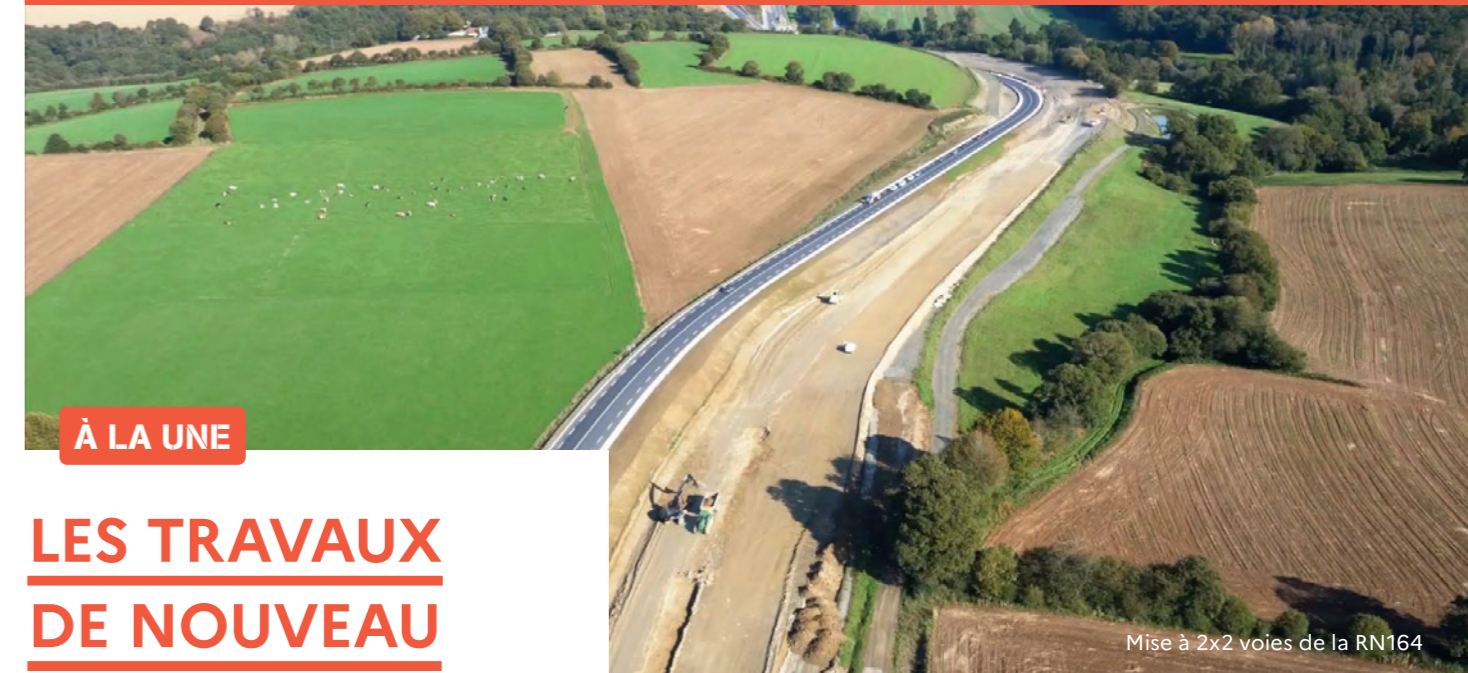
À LA UNE