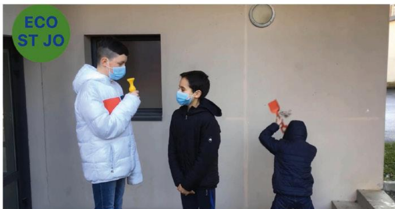
L'extraction des matières premières et leurs conséquences.