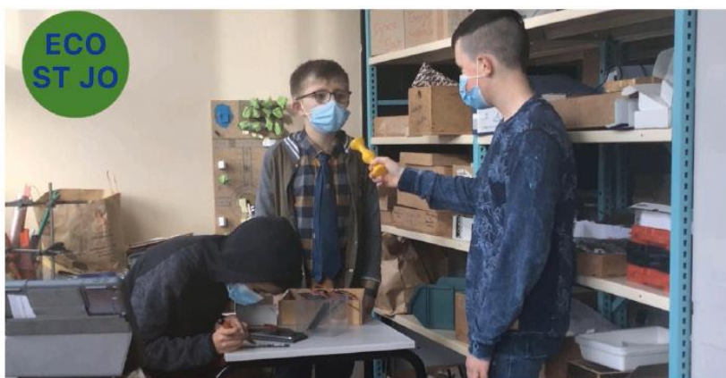
L'étape de fabrication dans le monde

2. Conseils : recycler les appareils, collecter, réparer, utiliser de l'occasion.