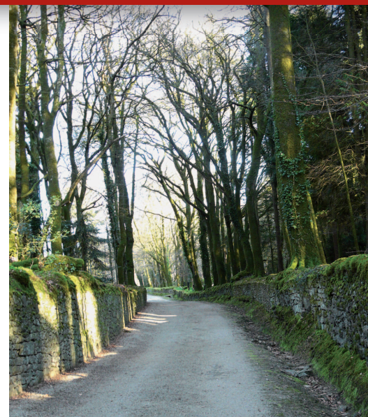
▲ L'allée magistrale s'étire au travers du boisement en direction du bourg.

Autour du manoir, un jardin d'agrément d'environ 2 hectares a été aménagé vers 1865. Ce parc offre de nombreuses espèces végétales rares. Des bosquets romantiques,