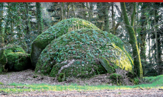
▲ Des blocs de granit sculpturaux se dressent au sein du boisement.

ries sont tapissées de vivaces et de bulbes qui révèlent des couleurs flamboyantes. Des aménagements récents sont en cours. Le paysagiste breton Erwan Tymen a créé ici un petit jardin à thème dit « jardin blanc ». Il est composé de façon géométrique avec des bordures en buis taillé encadrant une végétation de vivaces. La cour du manoir est en chantier. Son projet d'aménagement prévoit un pavage en granit et l'installation, face au manoir, d'un escalier magistral menant à une grande pelouse en pente qui sera aménagée en « vertugadin », terrasses engazonnées formant un amphithéâtre de verdure dont les plissés de terrain rappellent les robes des femmes à la Renaissance.