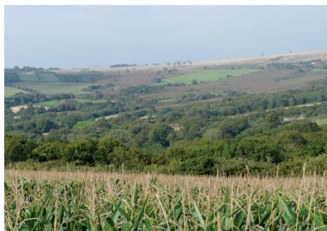
▲ Le versant ouest du Ménéz-Hom, une mosaïque de bois, de landes et de parcelles encore agricoles.

sent. Les boisements épars entraînent un mitage et perturbent la lecture du site. Au sein de ces derniers, les troncs calcinés, traces des derniers incendies, renforcent l'aspect « désolé » des lieux.