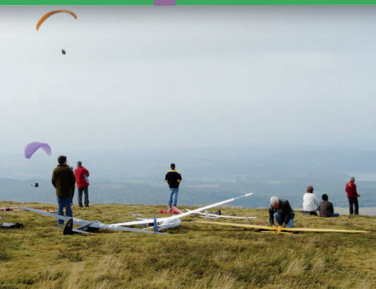
▲ Le sommet du Ménez-Hom, un haut lieu pour le parapente et l'aéromodélisme.