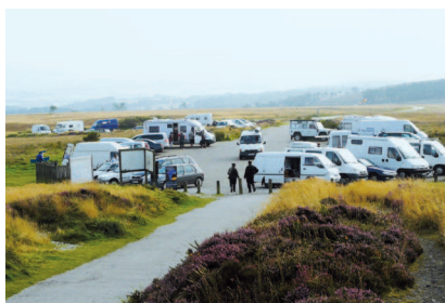
▲ Le parking sommital, une forte prégnance dans le site.

nues et des boisements. Cette trame verte rythme le paysage, tout en ménageant des perspectives visuelles lointaines. Enfin, la haute vallée de l'affluent du Garvan apparaît comme un espace fermé du fait de sa topographie encaissée et de la présence de boisements.