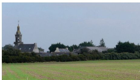
▲ Le village de Sainte-Marie-du-Ménez-Hom dominé par le clocher de la chapelle, classée monument historique.

La partie inférieure des versants nord et est du Ménéz-Hom ainsi qu'une grande partie de la chaîne des trois Runs sont fortement enrésinées. Il s'agit soit de vastes peuplements denses et linéaires résultant de plantations, soit de petits bosquets et de sujets épars issus d'une colonisation naturelle. Les plantations rythmées contrastent fortement avec les grands espaces de landes, ferment le paysage et l'assombris-