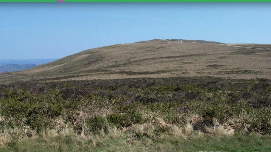
▲ Les sommets de la montagne, de vastes espaces de landes à l'ambiance presque « lunaire ».

qui s'étend au nord du village de Sainte-Marie-du-Ménez-Hom. Enfin, le flanc ouest présente une forme concave très marquée, particulièrement perceptible depuis la route départementale n° 887.