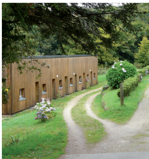
▲ Ce bâtiment en bardage bois serait pour partie inclus dans le site classé.