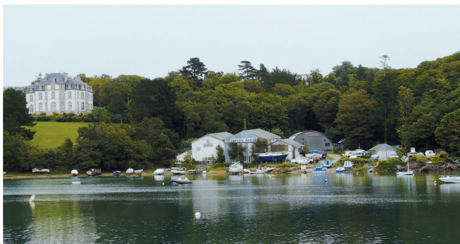
▼ L'atelier de réparation navale contraste avec le château et son parc.