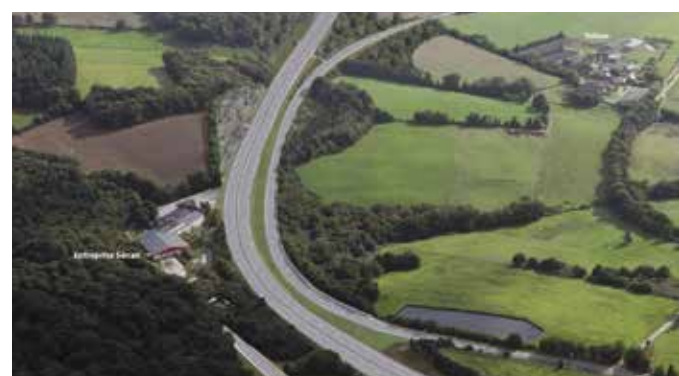
→ Photomontage entre l'entreprise Senan et la Ville Jan

à la page de l'Aménagement du secteur de Mûr-de-Bretagne. La maquette permettra également d'extraire des vues depuis d'autres points caractéristiques.