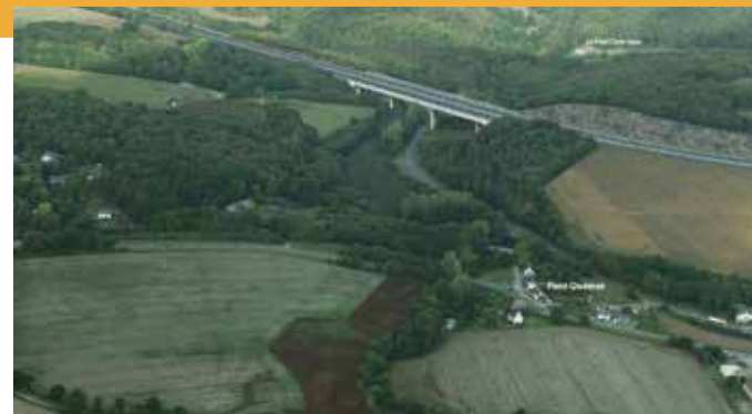
→ Photomontage de la nouvelle voie et du viaduc sur la Poulancre

Au vu des inconvénients du projet initial sur le bourg de Saint-Guen, et après étude des différentes variantes, la DREAL a retenu de décaler l'échangeur Est plus à l'ouest sur la RD 35 sans voie de liaison directe vers la zone d'activités de Guergadic. Cette solution, plus compacte et moins chère, limite aussi le morcellement agricole. Elle occasionne toutefois un léger détour pour certains usagers (allant de Rennes à la zone d'activités par exemple).