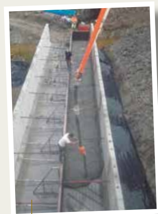
Coulage de banquettes en béton dans l'ouvrage pour le passage de la petite faune.