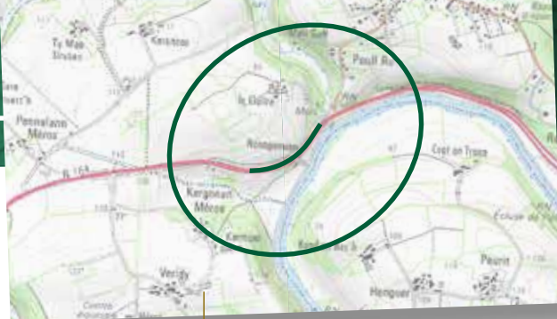
Carte du périmètre dans lequel seront réalisés des constats par un expert

Le coût de toutes les mesures de protections phoniques, comprenant neuf merlons, deux murs antibruit et six protections de façades, se monte à environ 400 000 euros.