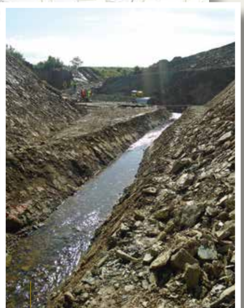
Le Poull Ru est temporairement dévié pour faciliter les travaux.

Pour ne pas impacter le fonctionnement du cours d'eau pendant les travaux, celui-ci a été dévié provisoirement de son lit naturel. En parallèle, une pêche de sauvegarde a été réalisée par la Fédération de Pêche du Finistère afin de capturer les poissons piégés et de les relâcher en dehors de la zone de travaux.