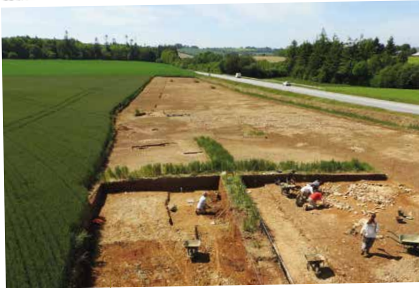
Vue du tumulus en cours de fouille

Le site, dans sa partie ouest, a également été occupé à l'époque médiévale. Les archéologues ont révélé la présence de deux silos ayant également servi de foyers. L'un d'eux a livré de nombreux tessons de céramique, permettant de supposer l'existence d'un habitat à proximité.