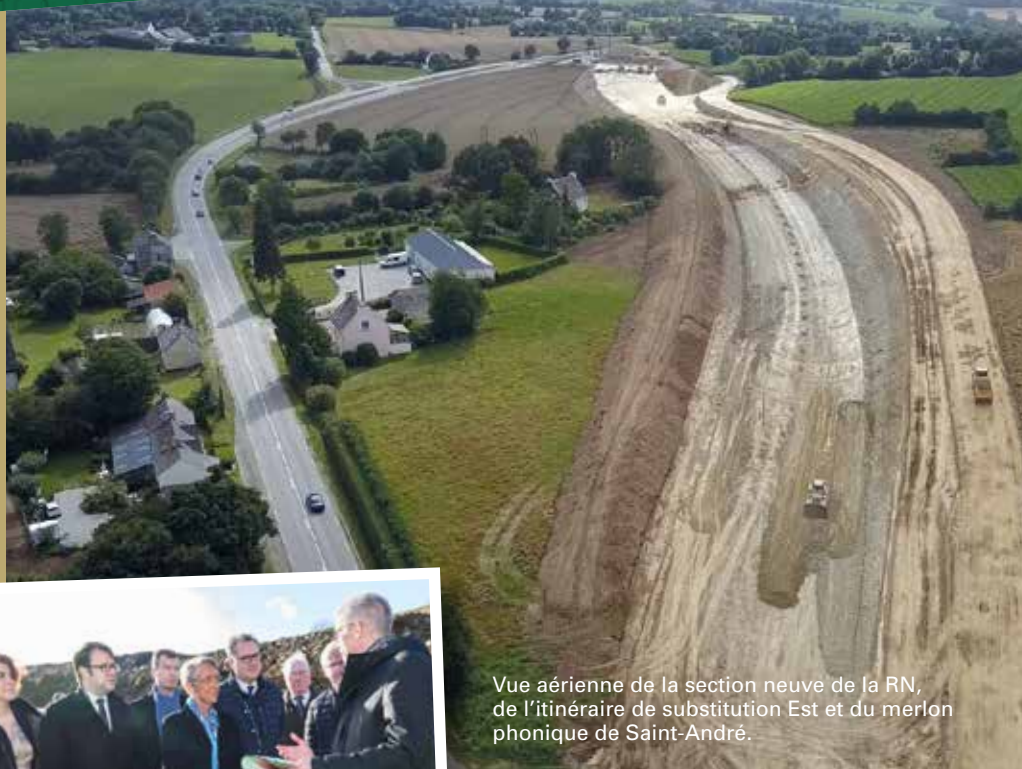
Vue aérienne de la section neuve de la RN, de l'itinéraire de substitution Est et du merlon phonique de Saint-André.

Le chantier a été marqué par la visite de la ministre des Transports le 5 janvier 2018. La mobilisation des différentes équipes s'est trouvée confortée par l'intérêt que celle-ci a porté au projet. Leur détermination à faire avancer le chantier dans les meilleures conditions, en y associant habitants et usagers, s'est vu ainsi renforcée.