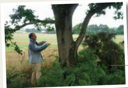
Mesure des troncs par le géomètre

Pour votre sécurité, et plus globalement pour celle de tous les intervenants sur le chantier, merci de continuer à rester prudents à l'approche des travaux.