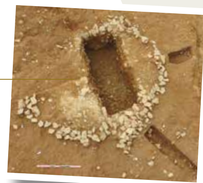
Petit cairn en pierres, sans doute à l'origine de l'édification du tumulus.