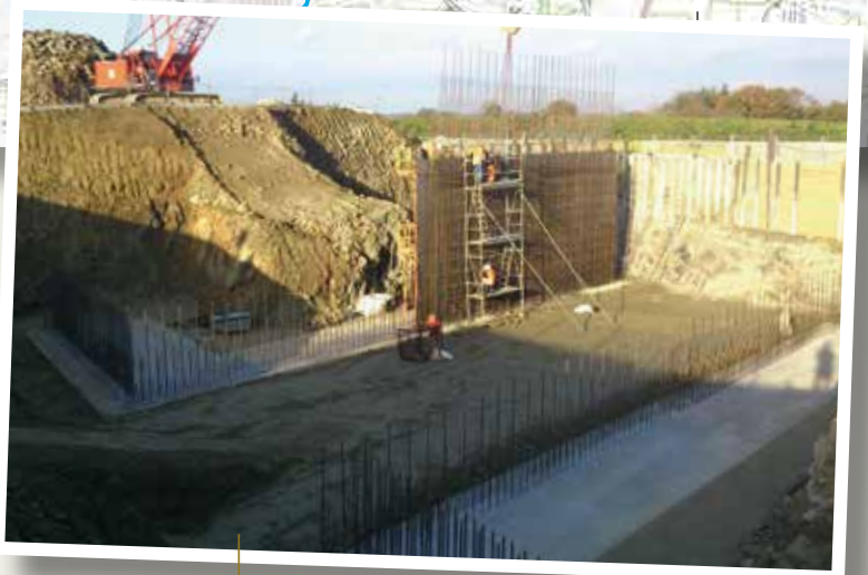
Ouvrage d'art à Magorven (OA2)

Restauration de zones humides et aménagement de cours d'eau : Pigeon Bretagne Sud.