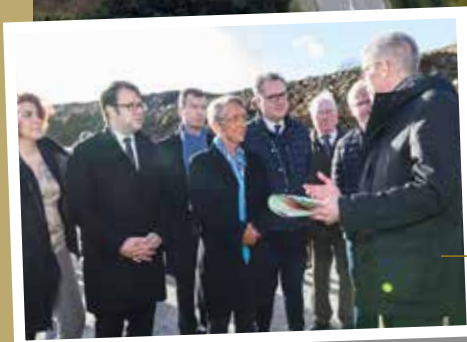
Visite du chantier par la Ministre en présence des élus bretons co-financiers.