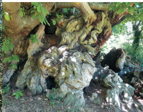
▲ Les bois vivant et mort de l'arbre s'enchevêtrent.