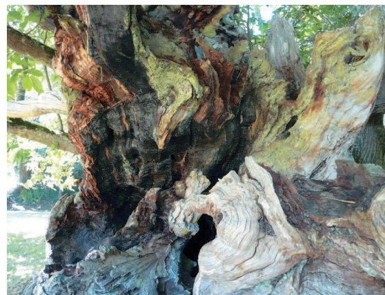
▲ Les couleurs grisâtre et noir caractérisent la partie de tronc sans vie.

Ce châtaignier a plusieurs visages. Une face vivante, à l'écorce régulière, aux branches couvertes de feuilles et de bourgeons, et une face où la vie s'est en partie retirée. L'écorce y a disparu ; le tronc est très tourmenté et sinueux. Une plage du tronc est noircie comme si elle avait brûlé, tandis qu'une autre est blanchie