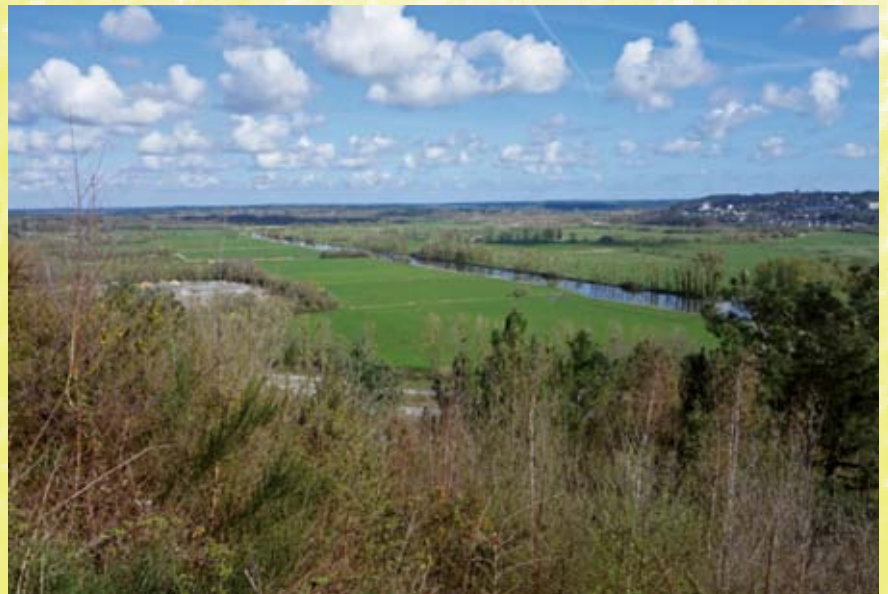
La vallée de l'Oust vue du belvédère d'Aucfer.

En aval de Redon, la vallée de la Vilaine en confluence avec l'Oust offre une très large vallée à fond plat entourée de collines de 35 à 50 m, occupée par une vaste étendue de marais que l'urbanisation a pour partie envahie. Cette géomorphologie est liée aux verrous de Rieux et de Folleux dus à des formations géologiques résistantes à l'érosion qui ont bloqué les sédiments à l'amont. L'incision de la Vilaine dans la structure géologique a été gommée par la transgression flandrienne qui a engendré une ria – la plus importante de Bretagne. La mer est ainsi arrivée jusqu'à Redon, un port de mer jusqu'à la construction du barrage d'Arzal. Les hauteurs de la rive droite de la vallée, de Saint-Jean-la-Poterie à Folleux, offrent des belvédères naturels qui permettent une bonne lecture du paysage et la compréhension de son histoire. Une histoire naturelle sur des millions d'années transformée in fine par l'homme en quelques décennies !