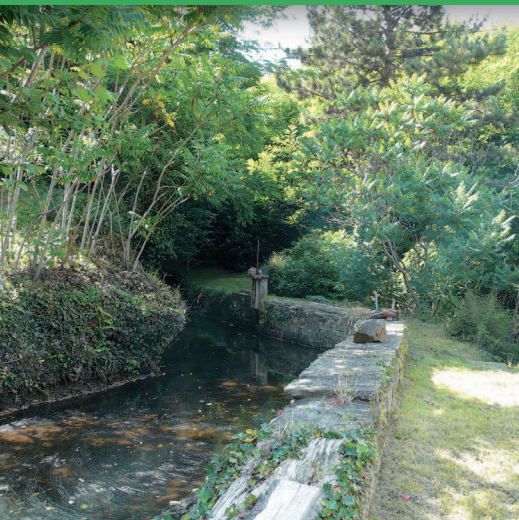
▲ La dérivation du cours d'eau longe le jardin.