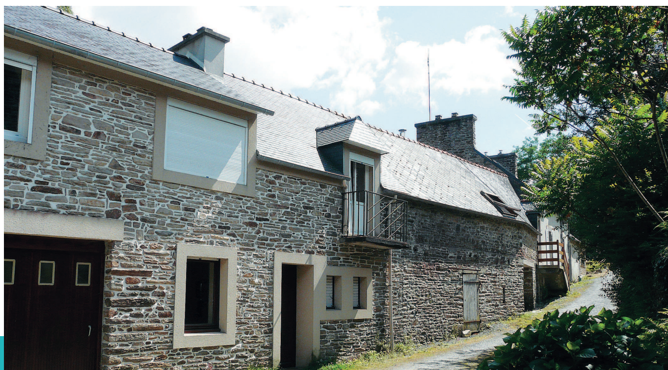
▼ La maison d'habitation a connu des modifications importantes.