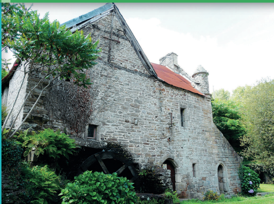
▲ Le cadre arboré et jardiné du moulin.