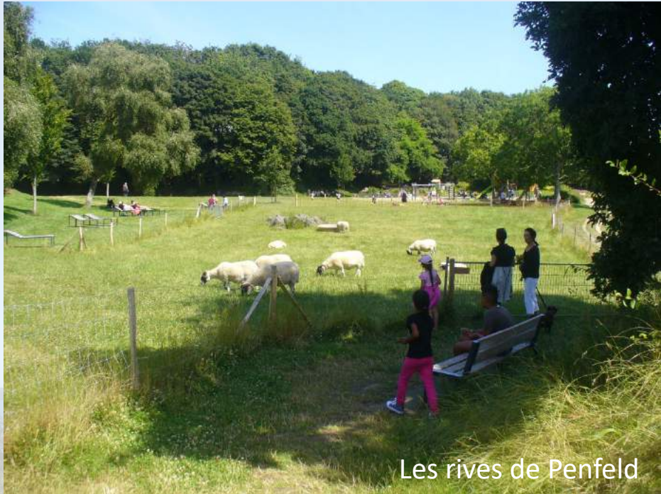
Les rives de Penfeld