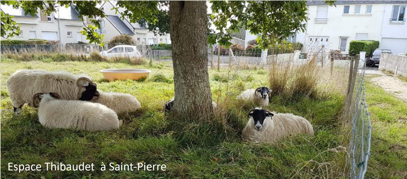
Espace Thibaudet à Saint-Pierre