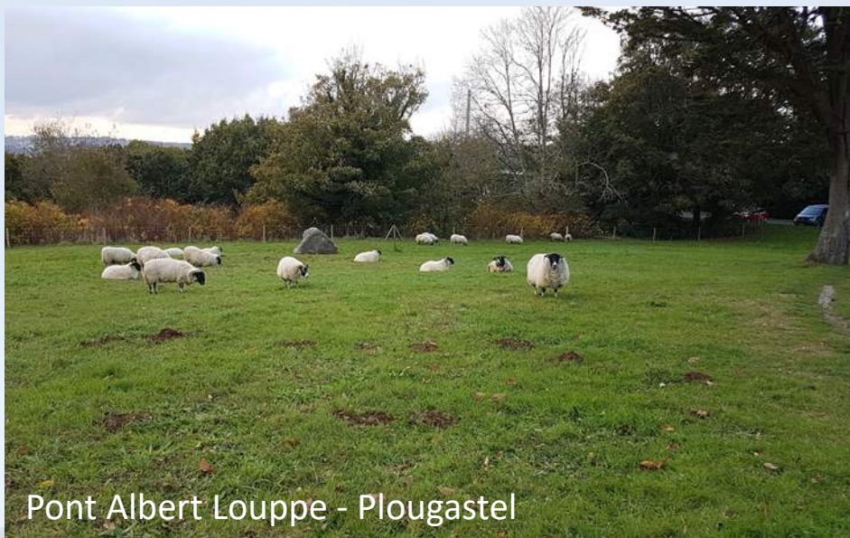
Pont Albert Louppe - Plougastel