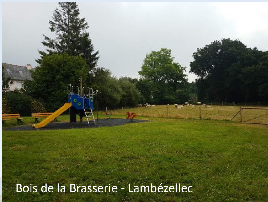
Bois de la Brasserie - Lambézellec