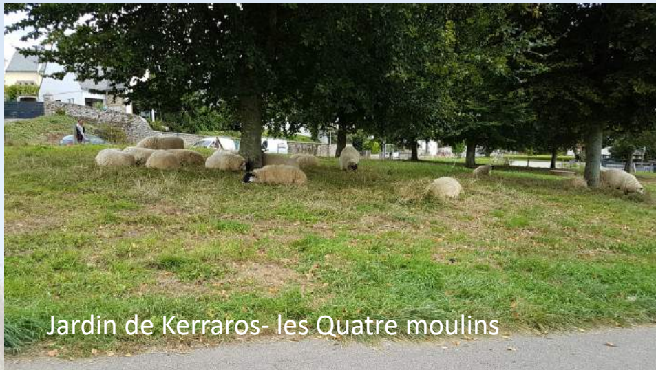
Jardin de Kerraros- les Quatre moulins