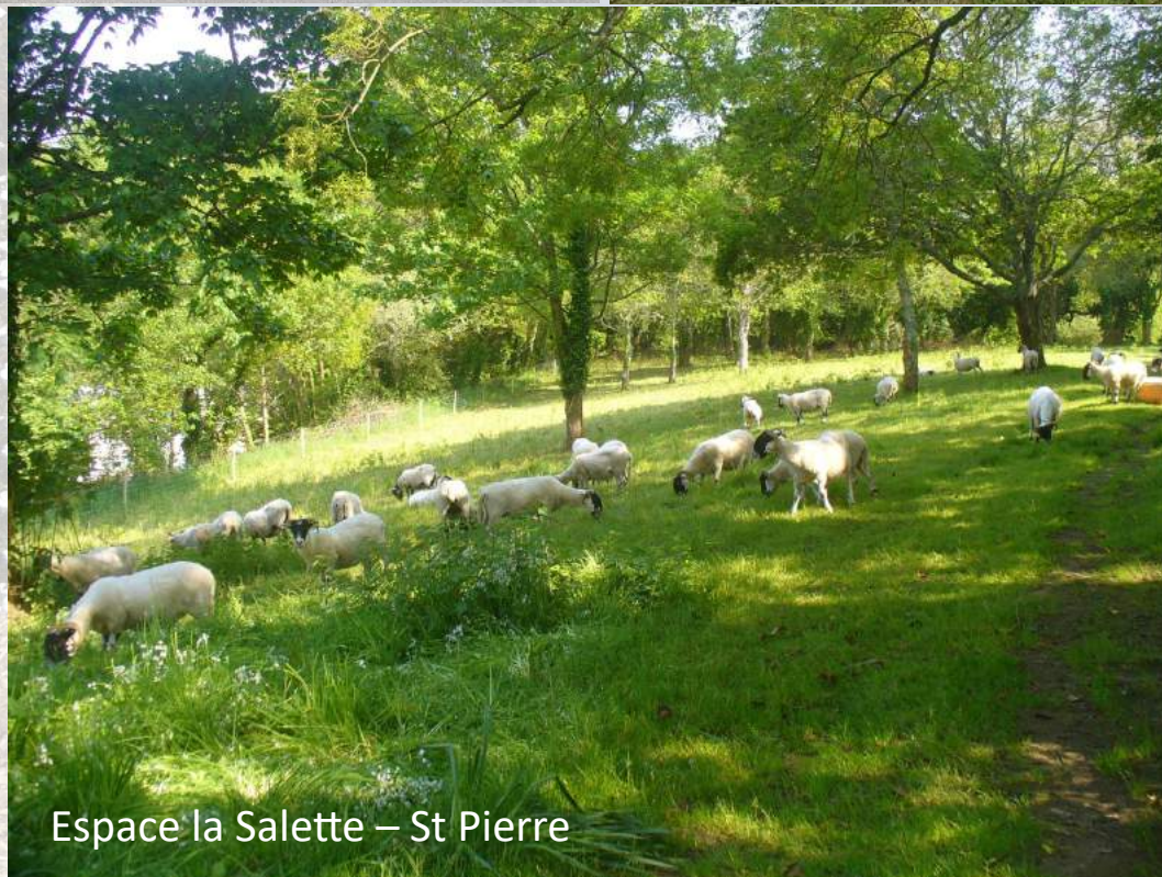
Espace la Salette – St Pierre