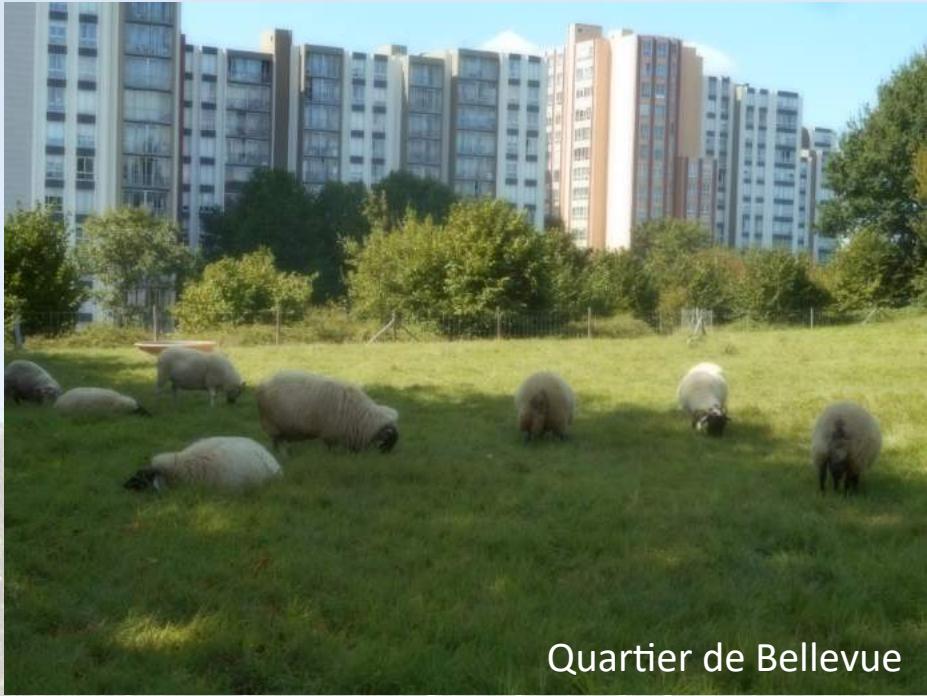
Quartier de Bellevue