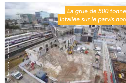
La grue de 500 tonnes installée sur le parvis nord

Les travaux sont réalisés par l'entreprise de bâtiment et de travaux publics LEON GROSSE intervenant sur toute la France. C'est le bureau d'études AREP, filiale de SNCF rattachée à la branche Gares & Connexions, qui effectue la maîtrise d'œuvre conception et travaux de l'opération.