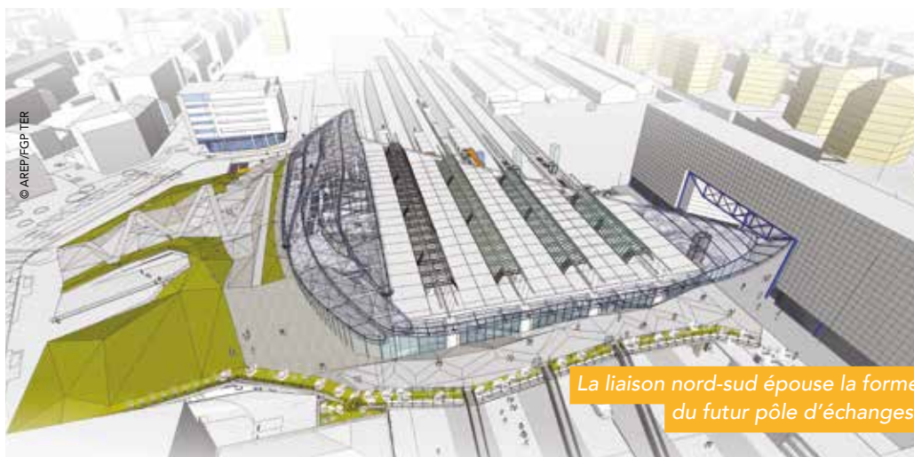
La liaison nord-sud épouse la forme du futur pôle d'échanges.

Les 23-24 et 30-31 janvier 2016, SNCF et ses partenaires effectuent la pose du tablier de la future liaison nord-sud. Ces travaux spectaculaires nécessitent l'interruption du trafic ferroviaire et la fermeture de la gare de Rennes.