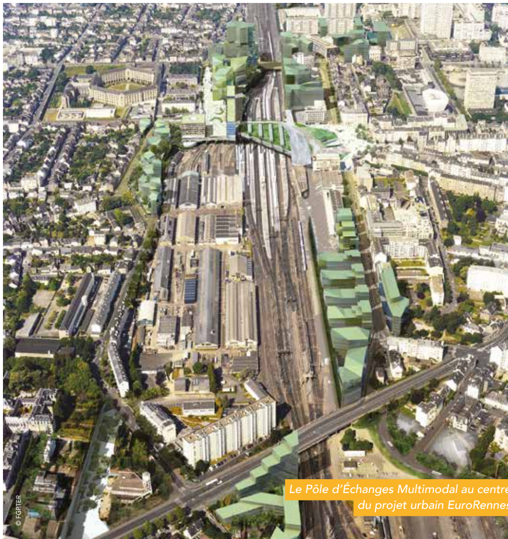
Le Pôle d'Échanges Multimodal au centre du projet urbain EuroRennes

S'étirant autour et de part et d'autre d'une gare entièrement reconfigurée, le projet EuroRennes est un projet d'aménagement d'envergure métropolitaine dont le premier effet est de contribuer à l'extension du centre-ville de Rennes vers le sud.