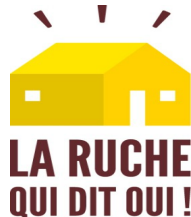
Plate-forme connectant producteurs et consommateurs. Chaque semaine, chaque groupe local organise des ventes en ligne, où les consommateurs peuvent commander les produits qu'ils veulent parmi l'offre locale proposée. Les consommateurs se déplacent ensuite dans un endroit de collecte pour récupérer leur commande. leur commande.