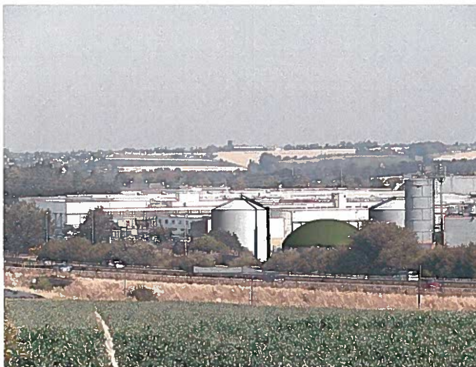
Vue simulée de l'unité de méthanisation, depuis le sud de la RN 12 (extrait du dossier)