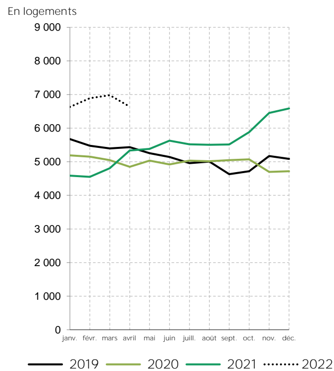
Logements commencés dans le Finistère en 2019, 2020, 2021 et 2022 (cumulés sur 12 mois glissants)