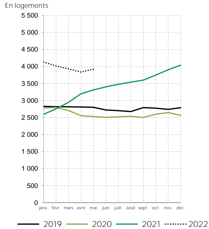
Logements commencés dans les Côtes-d'armor en 2019, 2020, 2021 et 2022 (cumulés sur 12 mois glissants)

Source : SDES MTE, Sit@del2, estimation à fin mai 2022