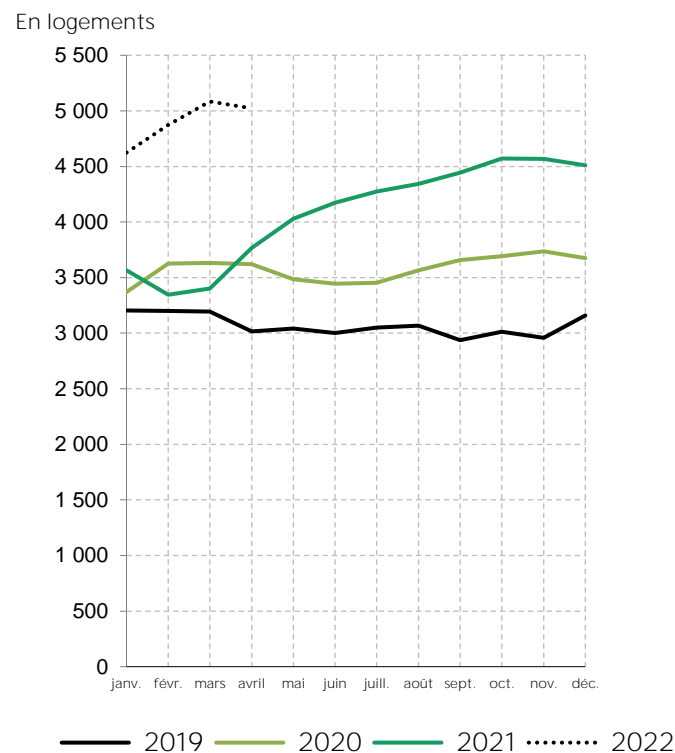
Logements autorisés dans les Côtes-d'Armor en 2019, 2020, 2021 et 2022 (cumulés sur 12 mois glissants)