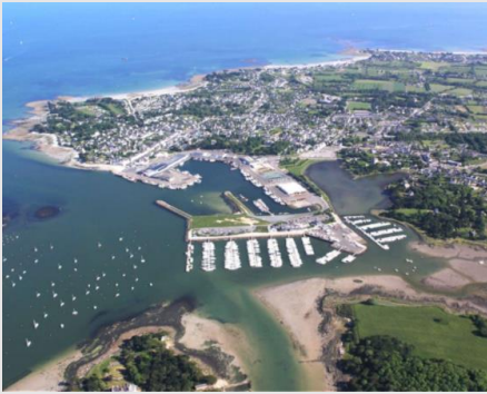
Deux ensembles portuaires déconnectés de la centralité urbaine

Les clés du succès de la politique locale de revitalisation :