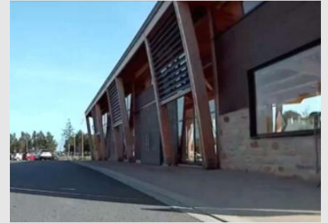
Une halle commerciale « centre de vie »

Notre ville est engagée dans un projet similaire, mais quel est le temps nécessaire ?