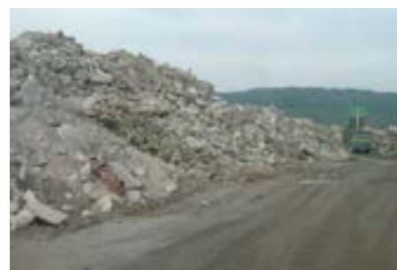
Exemple de décharge illégale.

La décharge est exploitée ou détenue par une entreprise, un particulier ou une collectivité.