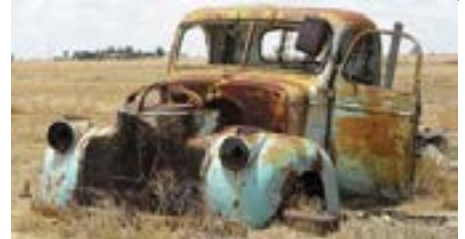
Exemple : véhicules accidentés ou visuellement inapte à rouler.

Dans l'usage, on considère que de 1 à 10 véhicules,