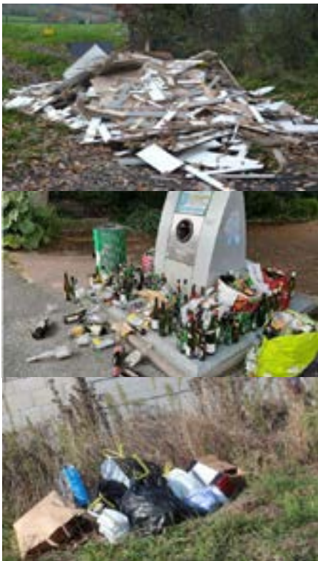
Exemple de dépôts illégaux sur un terrain privé ou dans l'espace public.

Au delà, c'est la police ICPE qui intervient.