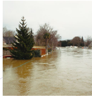
La Vilaine à Pont-Réan