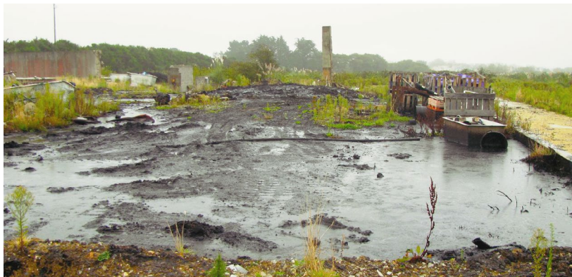
Devant la cuve

Si le bien immobilier est situé dans une zone d'exposition au bruit des aéroports, le vendeur ou le bailleur doit également fournir un diagnostic Bruit à l'acquéreur ou locataire depuis le 1 er juin 2020.