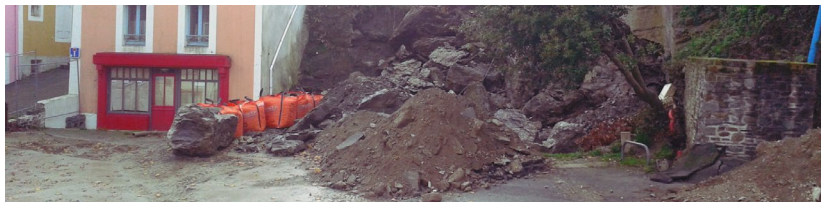
Éboulement à Sauzon

Le DICRIM fait l'objet d'un avis affiché à la mairie pendant au moins deux mois et peut-être consulté librement en mairie.