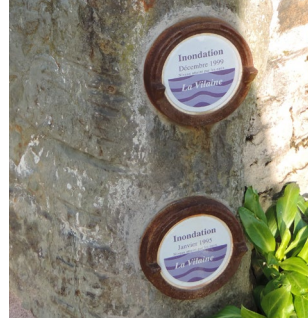
Repères à Pont-Réan

Les nouveaux repères doivent être conformes au modèle arrêté par les ministres en charge de la prévention des risques et de la sécurité intérieure.