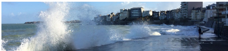
Submersion marine à Saint-Malo

Ce guide vise à accompagner les collectivités territoriales dans la mise en œuvre de leurs obligations en matière d'information préventive : il en rappelle les principales procédures et propose également des outils pratiques pour les aider dans leur démarche.