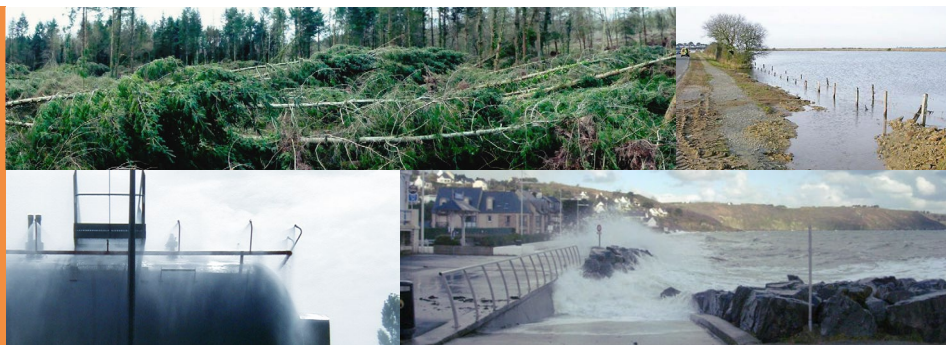
Dégâts suite à la tempête Zeus de mars 2017 - Billiers - Test d'arrosage d'une cuve de gaz inflammable - Submersion marine aux Rosaires à Plérin, mars 2007