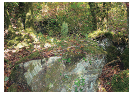
▲ Mousses, fougères, arbustes et arbres ont colonisé le Roc'h Veur.

protection en 1910. Elle ne concerne a priori que le chicot rocheux situé au point culminant. Il s'agit d'une arête minérale très largement colonisée par la végétation : les mousses et les fougères couvrent les blocs de quartzite; les ronces, les ajoncs et les fougères aigles concurrencent la myrtille et tendent à envahir le site; le tout est dominé par quelques chênes rabougris.