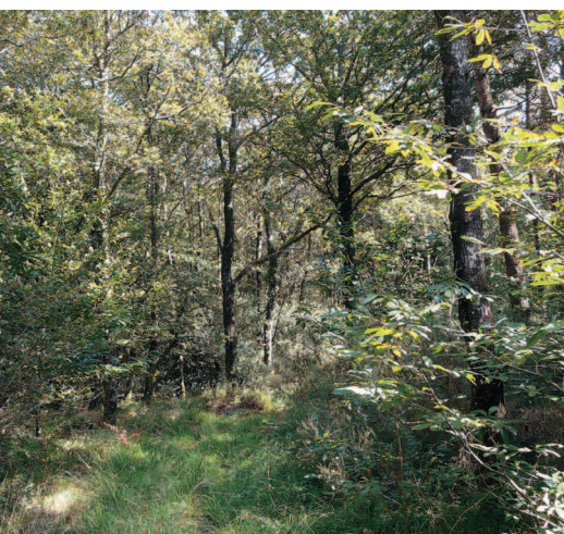
▲ Le boisement qui entoure les rochers du Roc'h Veur est dominé par les feuillus.

Le Roc'h Veur s'inscrit au sein d'un boisement de feuillus. La dynamique naturelle de la végétation participe à son occultation. Aucune perturbation liée à des aménagements ou à la fréquentation n'est à noter.