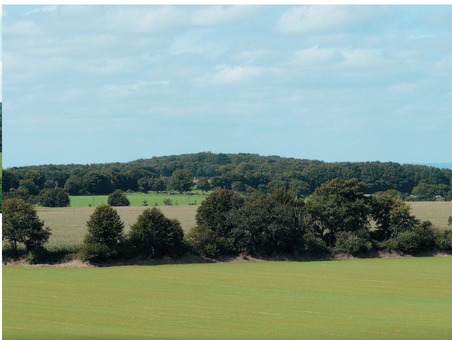
▶ Depuis le sud-est, le sommet du Roc'h se différencie peu.