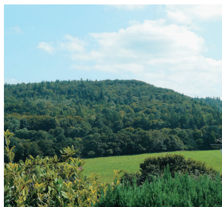
▲ Depuis le bourg de Saint-Goazec, le sommet du Roc'h Veur crée un effet de barrière visuelle.