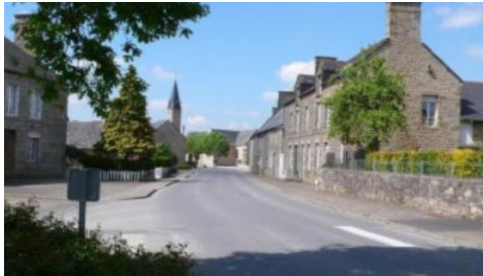
Les centres-bourg ruraux du Coglais (35)