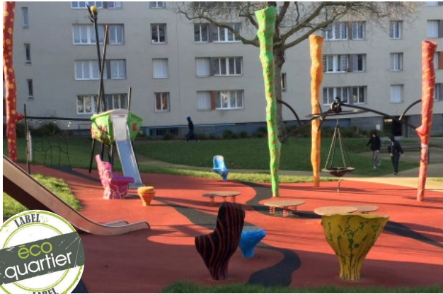
Quartier de l'Europe - Saint-Brieuc (22)