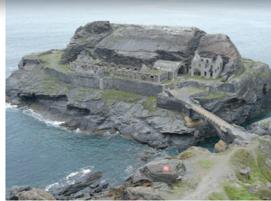
▲ Les fortifications de l'îlot des Capucins, un des nombreux vestiges de défense côtière inclus dans le site classé.

▼ Le littoral ouest de la presqu'île de Roscanvel et, au second plan, Camaret-sur-Mer.