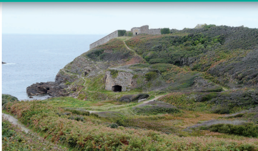
▲ Le fort de la Fraternité est implanté sur un promontoire défendant la seule crique du littoral ouest (au pied, le four à chaux).

Le site classé sur la presqu'île de Roscanvel présente un bon état de conservation. Sur le plan paysager, il offre des ambiances très variées. Sa côte rocheuse recèle une série de promontoires impressionnants, avec des panoramas diversifiés sur l'anse de Camaret et la pointe du Grand Gouin, sur la mer d'Iroise et le littoral sud du Léon, et sur le goulet et la ville de Brest. À ces panoramas grandioses s'opposent les points de vue sur la baie de Roscanvel possibles au droit des secteurs protégés de la côte est. Enfin, les mouvements du relief et la diversité de l'occupation du sol créent localement des mosaïques de couleurs et d'ambiances qui tranchent avec les vastes étendues de bruyères, d'ajoncs et de fougères aigles.