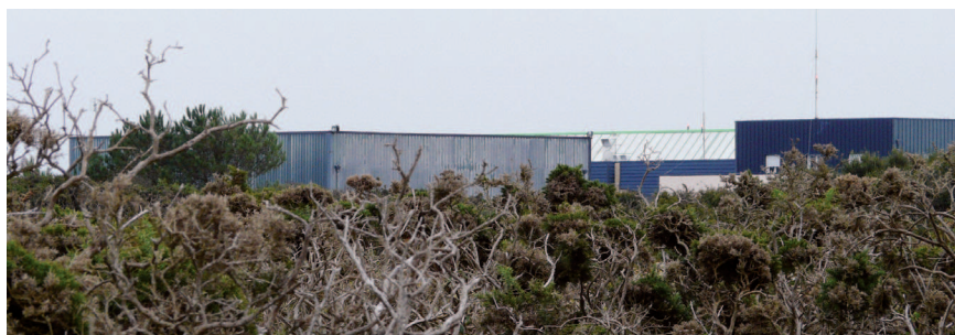
▲ Les installations militaires autour du fort de Quélern ont des volumétries imposantes, qui contribuent localement à l'artificialisation du site.

L'ensemble de la zone protégée est doté d'un fort intérêt scientifique lié aux formations végétales et aux espèces végétales et animales qui peuvent être observées. En outre, plusieurs sites, tels que les falaises de la Mort Anglaise, ont un intérêt géologique, scientifique et pédagogique. Enfin, le site classé présente un intérêt historique très important. La diversité des ouvrages tant en terme de nature que d'époques de construction, notamment sur le littoral ouest, fait de ce dernier un véritable condensé d'histoire et d'art militaire.