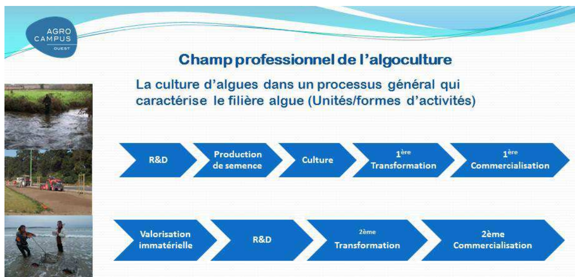
Schéma n°3 : Champ professionnel effectif de l'algoculture

Si la définition scientifique délimite facilement le champ de l'algoculture, il n'en va pas de même dans la réalité des pratiques. Le schéma n°3 présente le champ professionnel de l'algoculture tel qu'il est effectivement dessiné par les pratiques effectives des entreprises dont une partie seulement des activités est consacré à la culture proprement dite des algues.