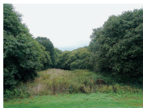
▲ Le bois de chênes entourant un talweg est bordé de châtaigniers.