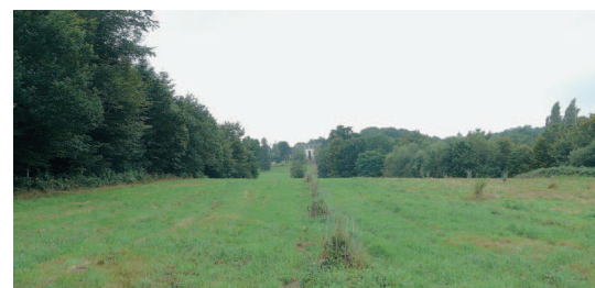
▲ L'alignement de rhododendrons et de conifères met en scène le château de Kerbernès.

Une longue prairie s'étire à la sortie du bois et laisse apparaître en arrière-plan le château de Kerbernès. Des alignements de conifères et de rhododendrons récemment plantés dessinent une perspective qui met en valeur l'édifice. Cet aménagement paysager crée un lien entre le château, l'îlot romantique et l'Odét.