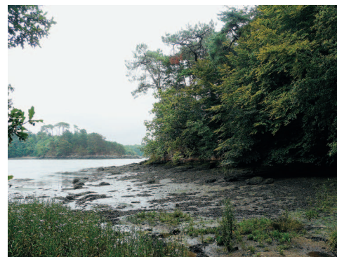
▼ Depuis les rives du site, il est possible d'avoir des vues sur le domaine de Lanroz.