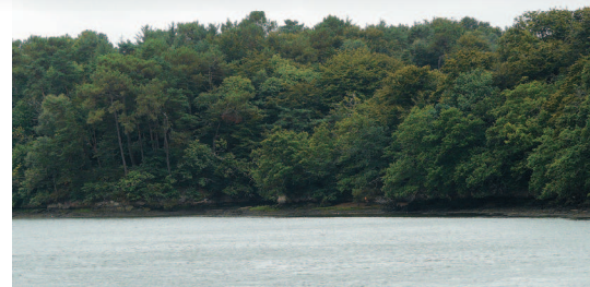
▲ Les arbres étalent leurs branches au-dessus de l'Odét.

À proximité de l'accès à l'îlot se trouve une petite maison inhabitée mais bien entretenue. Portes et fenêtres sont condamnées par des grilles.