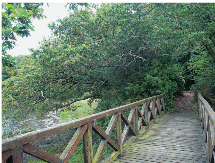
▲ Une passerelle de bois permet d'accéder à un îlot romantique.