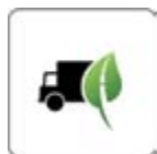
Idéogramme de signalisation routière