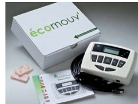
L'Ecomouv' Pass : l'équipement embarqué mis à disposition des redevables non abonnés

Après restitution et contrôle du bon fonctionnement de l'Ecomouv' Pass, Ecomouv' déclenche le processus de restitution du dépôt de la garantie et, le cas échéant, de liquidation de l'avance sur taxe résiduelle dans un délai maximum de cinq jours ouvrés, lorsque les coordonnées bancaires ont été préalablement communiquées. La restitution de l'Ecomouv' Pass s'effectue auprès d'un point écotaxe ou par courrier.