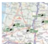
Carte routière Ecomouv'