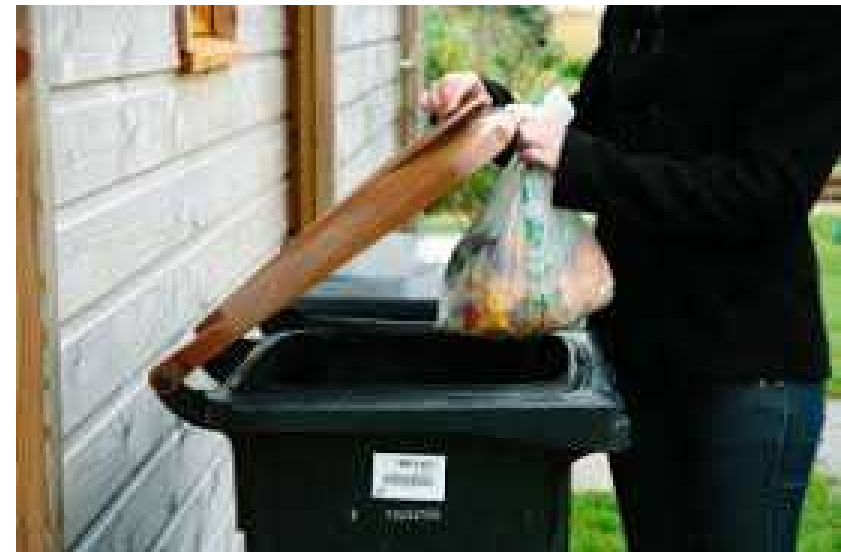
SMICTOM des Pays de Vilaine : tri à la source des biodéchets + tarification incitative