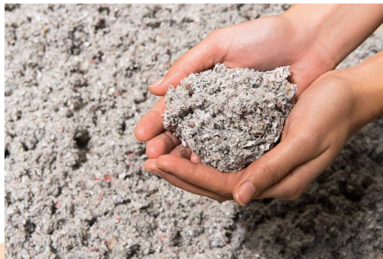
Isolant en coton recyclé