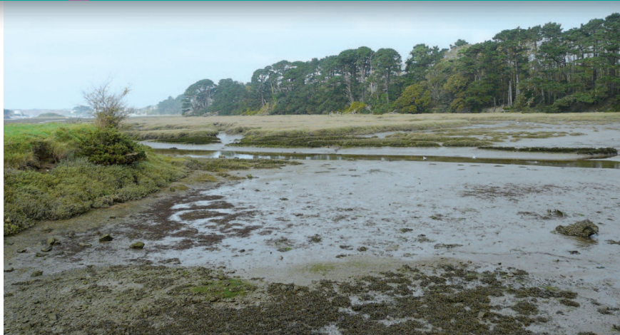
▲ Lorsqu'on s'avance dans les terres, les falaises rocheuses dénudées de végétation laissent place à des coteaux boisés sur lesquels les silhouettes des pins maritimes se dessinent comme des ombres chinoises à l'horizon.

La ria se découvre principalement depuis le réseau routier qui sillonne les coteaux. La départementale n° 789 qui borde la vallée en rive gauche offre de beaux panoramiques.