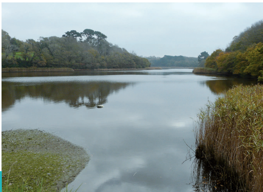
▼ Les coteaux boisés se reflètent dans la vaste miroir d'eau que constitue l'étang de Kerjean.

Ce dernier est situé en continuité de la ria, à l'ouest du bourg du Conquet. Il est surtout visible depuis la départementale n° 789 qui le borde au sud. C'est un vaste plan d'eau, de forme allongée, d'environ 700 mètres de long. La surface sombre de l'eau reflète les denses boisements des coteaux environnants. L'étang est séparé de la ria par une digue sur laquelle passe la départementale n° 67. Depuis cette voie, de magnifiques panoramiques sont possibles vers l'aber, le Conquet et l'étang de Kerjean.