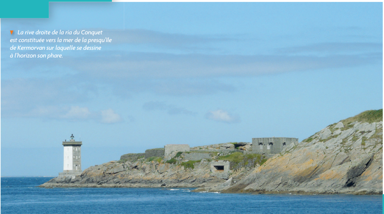
▼ La rive droite de la ria du Conquet est constituée vers la mer de la presqu'île de Kermorvan sur laquelle se dessine à l'horizon son phare.

La morphologie générale de la vallée présente un relief assez marqué avec des coteaux escarpés s'élevant à une quarantaine de mètres au-dessus du niveau de la mer. Le fond de vallée est très large à son embouchure et se rétrécit progressivement vers les terres jusqu'à devenir une vallée fluviale.