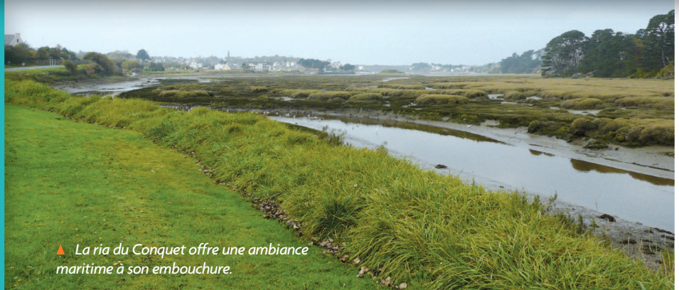
▲ La ria du Conquet offre une ambiance maritime à son embouchure.