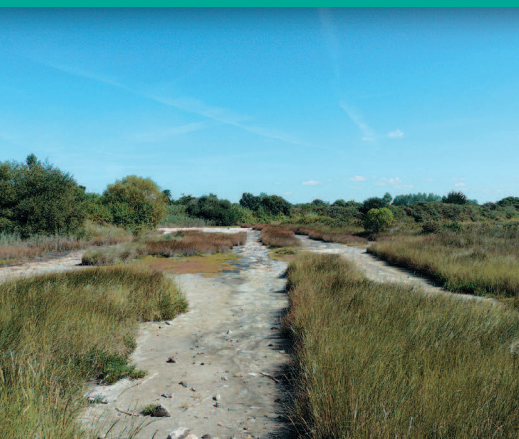
▲ Les zones humides de l'arrière-dune s'assèchent en été.

entre Sainte-Marine et le Sillon. De nombreux accès vers la plage sont organisés depuis cette piste et les parkings. Des ganivelles guident les promeneurs et assurent la préservation de la dune contre l'érosion et le piétinement. La partie ouest de la dune est la plus érodée. Les cyprès de Leyland contribuent à stabiliser le sol, mais bien souvent leurs racines sont à nues. Les oyats côté océan et d'autres plantes dunaires côté prairies, bien développés, recouvrent l'ensemble de la dune.