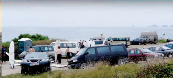
▲ La fréquentation de pointe autour des plages de la Palue et de Lostmarc'h est source de saturation des aires de stationnement.

Les plages de la côte ouest du site sont très prisées par les adeptes des sports de glisse. Les plus attractives sont celles de Lost Marc'h et de la Palue. On y accède par des voies en cul-de-sac desservant des villages. Les zones de parking ne suffisent pas à absorber les pointes de fréquentation. Il en résulte des stationnements anarchiques qui, combinés au camping sauvage, sont responsables d'une dégradation des milieux naturels.