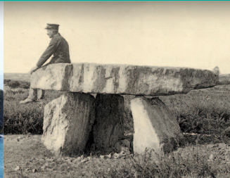
▲ Le dolmen de Rostudel sur le littoral est du cap.