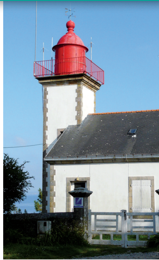
▲ Le phare de la pointe de Morgat.

Cette zone littorale se présente comme une étroite ligne de crête culminant à plus de 90 mètres au-dessus de la mer. Elle a pour assise des grès armoricains