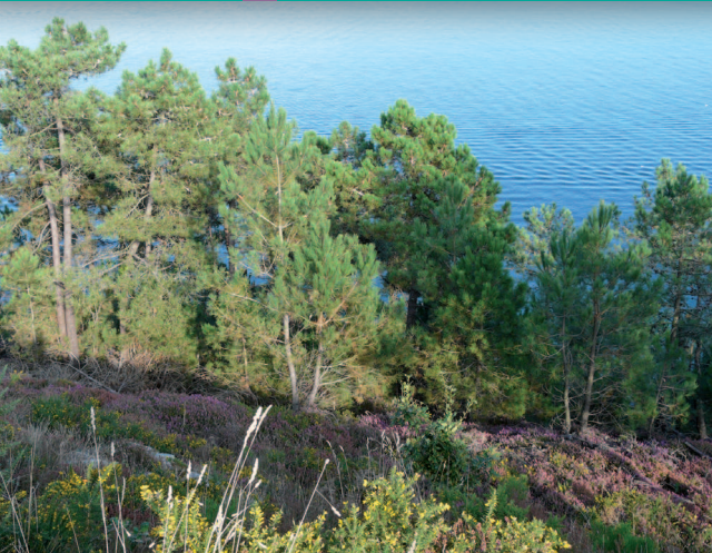
▲ À l'est, un littoral marqué par la présence des pins.