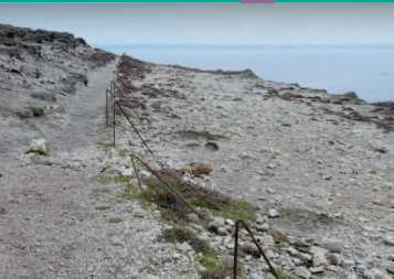
▲ À l'extrémité du cap, les zones érodées laissent la place à des étendues sans végétation.