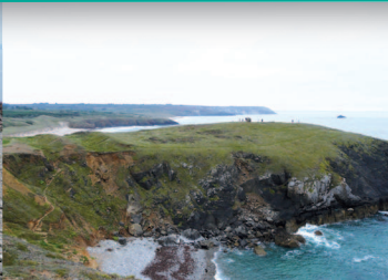
▲ L'éperon barré de Lostmarc'h, un des éléments du patrimoine humain du site.