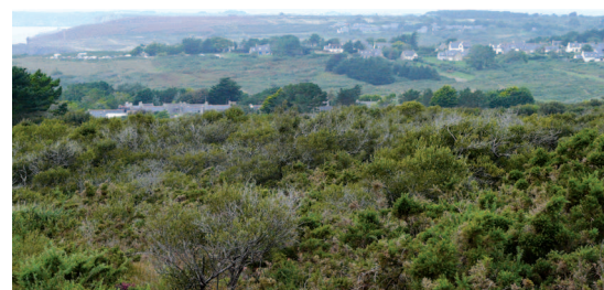
▲ Le littoral ouest, une succession de vallons et de lignes de crête parallèles, avec des hameaux implantés en point haut.

Les vallons débouchent sur des cordons dunaires et des plages parfois importantes comme celle de la Palue. À l'arrière, les cuvettes sont le domaine de la saulaie alors que les coteaux sont pour l'essentiel en fourrés de prunelliers ou d'ajoncs, les secteurs encore en prairie apparaissant très circonscrits.