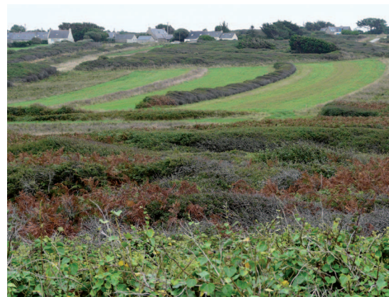
▲ L'abandon par l'agriculture de nombreux secteurs aboutit à leur enfrichement et à la raréfaction des prairies

• la mise en valeur insuffisante de certains éléments du patrimoine humain.