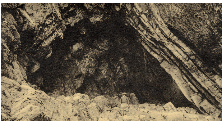
► La grotte Sainte-Marine, une curiosité touristique de longue date.