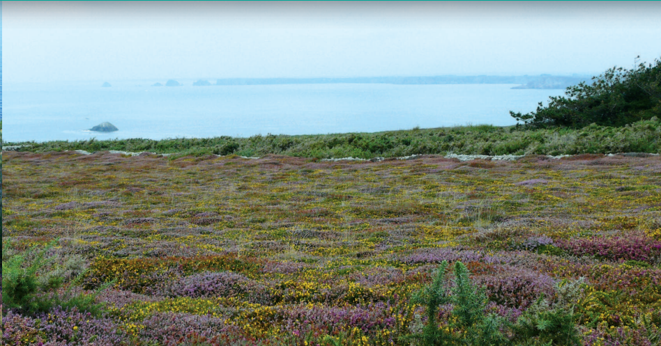
▲ La partie sud du cap est un plateau qui offre de larges panoramas (à l'horizon, la pointe de Pen Hir et les Tas de Pois).

très résistants qui expliquent la physiologie de l'ensemble. À partir des points hauts proches du trait de côte, un versant abrupt plonge vers la mer et s'achève par des falaises avec une succession rapide de caps et de criques. L'ensemble contribue à fractionner l'espace et à dynamiser la promenade sur le sentier côtier. L'occupation diversifiée du sol conforte cette dynamique : espaces colonisés par la fougère aigle, landes à ajoncs, fourrés de prunelliers, d'aubépines et de saules et bois de pins. Ces derniers sont devenus un repère lointain et créent localement une ambiance à connotation méditerranéenne. Ils participent au cloisonnement du milieu et à l'isolement du littoral oriental par rapport au reste du cap.