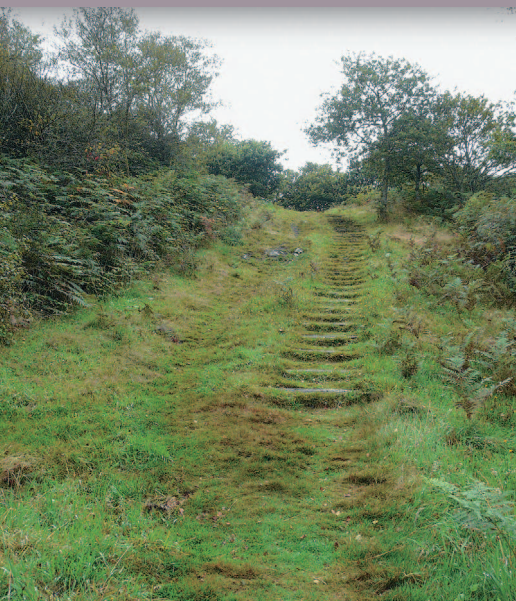
▲ Le cheminement, bien intégré au site, permet d'accéder au sommet de Carrec an Tan.

Douarnenez à l'ouest ainsi que trente-trois clochers dans un rayon de 40 kilomètres sont visibles par temps clair. Les perspectives sur le bocage sont grandioses. Les champs labourés ou cultivés affichent des couleurs jaunes ocre qui tranchent avec les verts des prairies ou des bois. L'ensemble est quadrillé par un réseau de haies au maillage variable.