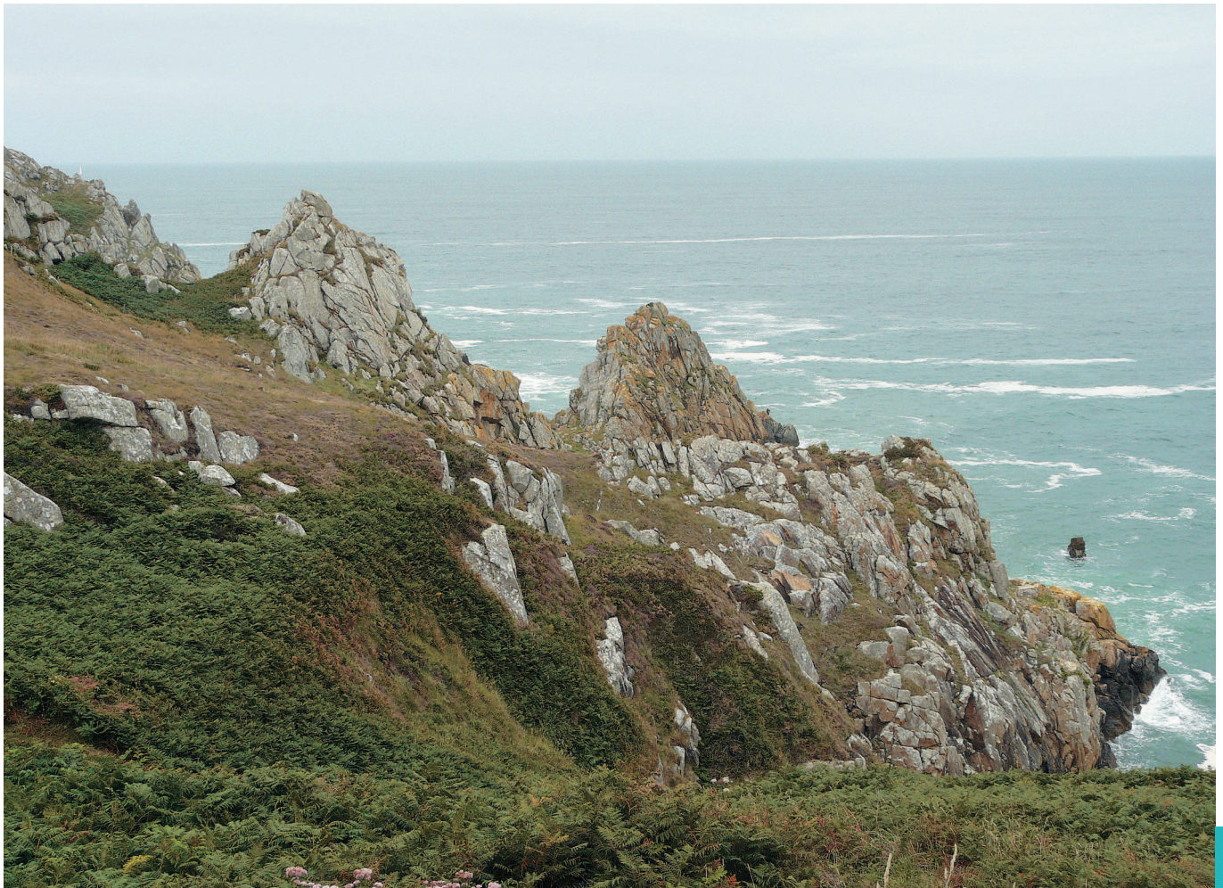
▼ La pointe de Brémeur.

Le site classé englobe une petite pointe rocheuse, étroite et peu saillante dans la mer. Le trait de côte est constitué de falaises granitiques, au sommet desquelles le couvert végétal soumis aux embruns et