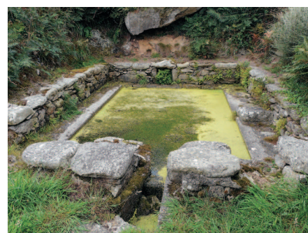
▲ L'ancien lavoir restauré.