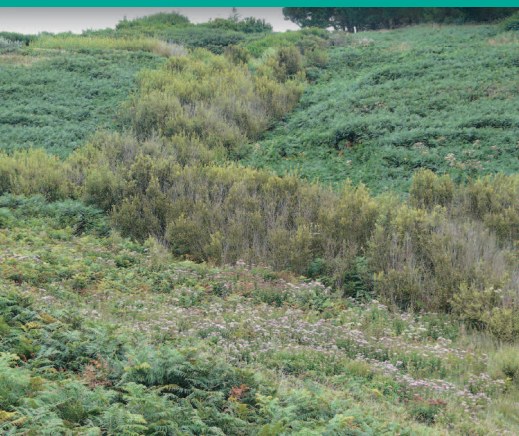
▲ Une partie est du site largement en friche.

au vent est formé de pelouses rases et de landes basses à bruyères.