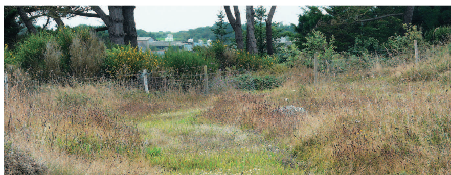
▲ Des actions de gestion de la végétation visent à favoriser le crabe à bec rouge.

► Au sud du site, des pins et des cyprès limitent la perception du lieu-dit Brémeur. Au premier plan, une zone de dépôts de matériaux divers.