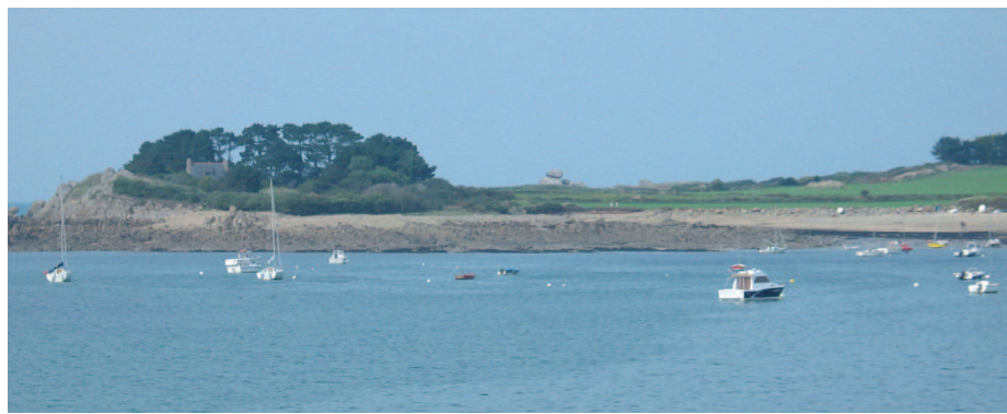
▲ La pointe Saint-Samson : une pointe peu élevée marquée par un bois de pins et de cyprès à son extrémité.