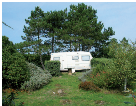
▲ La présence de camping-caravaning est incompatible avec la protection du site.