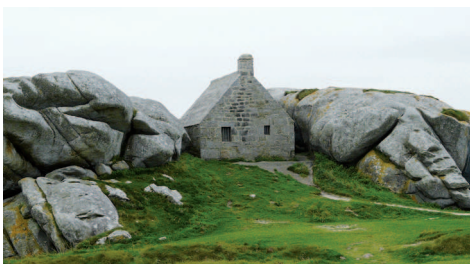
▲ Le corps de garde daté de la fin du XVII e siècle présente un parfait mimétisme avec les chaos de blocs granitiques environnants.