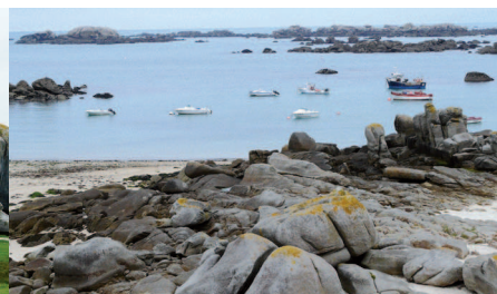
▲ L'espace marin a été classé sur une largeur de un mille.