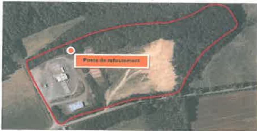
Carte 19, extrait de la page 93 de l'étude d'impact

Le projet concerne quatre parcelles cadastrées d'une superficie totale de 5,4 ha, situées à environ 500 m à l'Est du bourg, le long de la route départementale n°76. Le site comprend quatre parties : une zone anciennement aménagée pour la vente aux enchères de bovins, un boulodrome entre des haies, une ancienne décharge de déchets inertes (pierres, gravats, remblais) fermée par arrêté municipal le 15/06/2000 et recevant actuellement des déchets verts, une zone humide et majoritairement boisée sur tout le pourtour Nord et Est du site. Les abords du site sont agricoles et boisés.