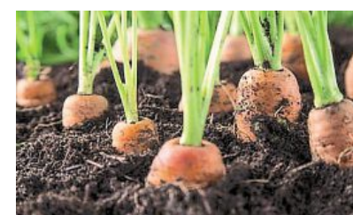
Du 20 au 30 mars, c'est la Semaine nationale pour les alternatives aux pesticides.

Au sujet des inscriptions, celles-ci se feront directement sur place de 13 h 30 à 14 h 30. « Une copie de la licence ou cas échéant un certificat médical de non-contre-