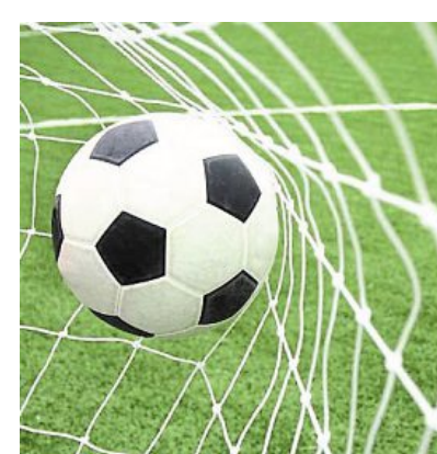
Une journée de détection est organisée ce mercredi.

Samedi 25 mars , de 9 h 15 à 12 h 15 et de 14 h à 19 h, à la Maison Point Vert, 1, rue Alfred-Sauvy, à La Selle-en-Luitré.