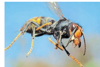
Fougères agglomération va financer la mise en place de 100 pièges pour lutter contre le frelon asiatique.

Ce piégeage sera mis en place du 1 er avril au 15 mai dans les huit communes les plus touchées (Fougères, Lécousse, Saint-Ouent-des-Alleux,