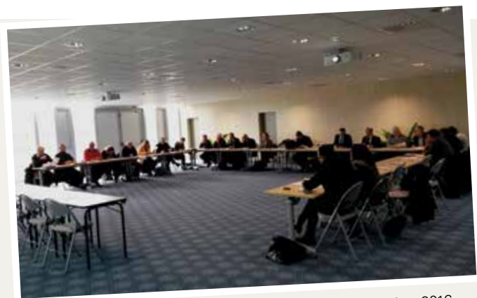
Réunion du comité de suivi des études du 19 décembre 2016.

Conscient de la nécessité de permettre à chacun, habitant et acteur local, d'être pleinement informé sur le projet et d'exprimer son point de vue et ses préoccupations, la DREAL Bretagne organise une concertation du 30 janvier au 3 mars 2017. Celle-ci s'inscrit dans le cadre réglementaire des articles L. 121-15 et suivants du Code de l'Environnement, issus des nouveaux textes de 2016 sur la démocratie environnementale.