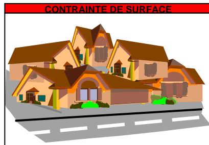
Tabl. 2 - Classes d'aptitude des sols et contraintes de typologie de l'habitat