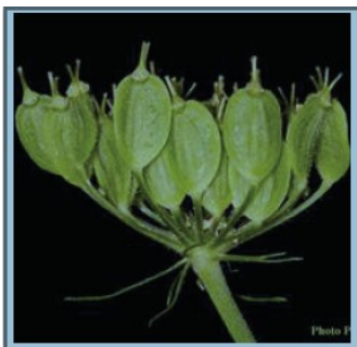
Photo des fruits de la Berce du Caucase (akènes)

Ne pas confondre avec la Berce commune :